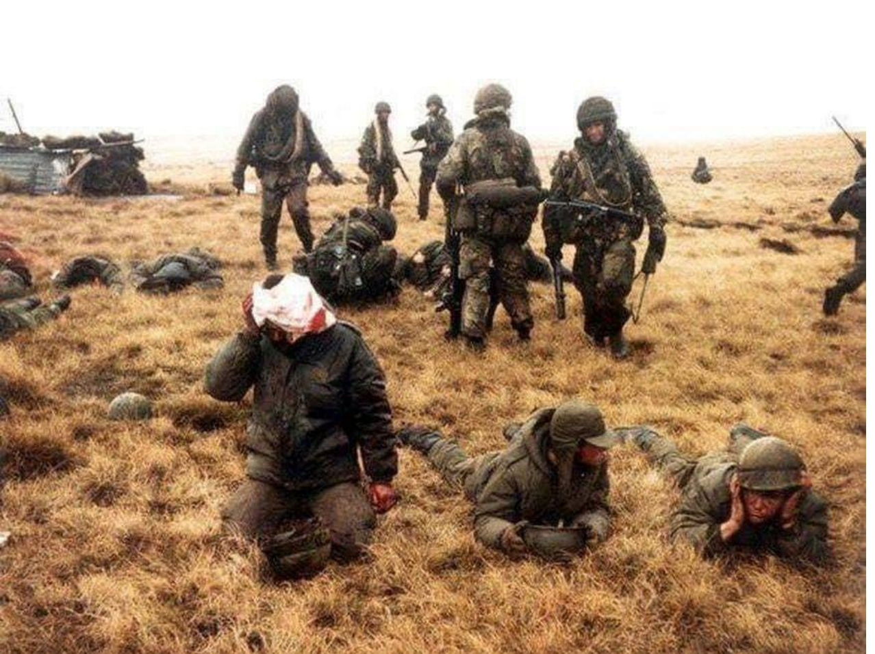
Libertos del 8 heridos luego de haber dado todo en combate