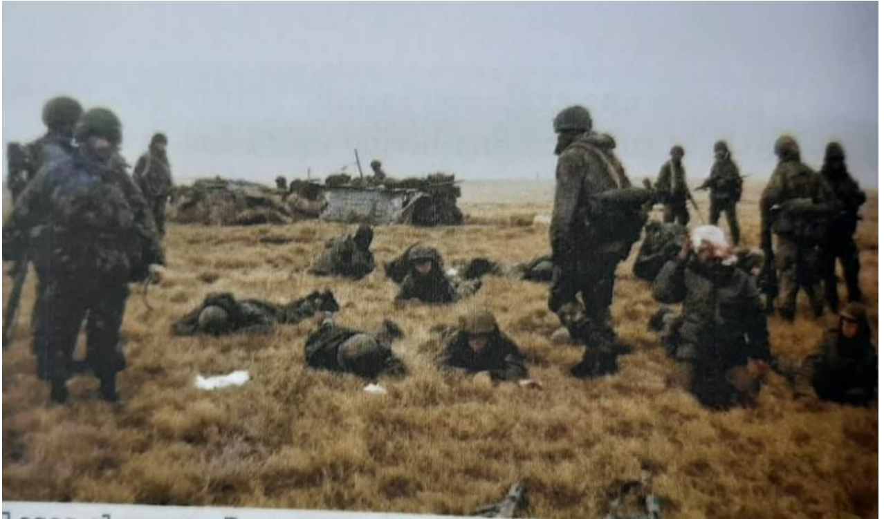
El Combate terminó... en suelo los heridos y remanentes de la 3/ C / 8